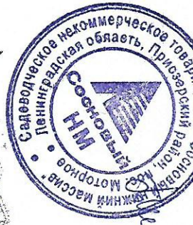
СХЕМА строительства низковольтной линии электропередач на 2019 год Председатель Правления СНТ «Сосновый НМ»

ПРИМЕЧАНИЕ: Вводы в дома выполнены проводом СИП-2а 2*16 мм 2 по системе заземления TN-C-S. Уличное освещение - 5кВ светодиодной ЖКУ300-150 с лампами ДНАТ-150, уроражение в КТП по схеме с фазоразре. На конечных опорах ВЛН-0,4 кВ установлены устройства для наклона переносного заземления согласно ПУЭ ВЛН-0,4 кВ. На вводах опор ВЛН-0,4 кВ или на вводах в здание установлена административная выключатель.